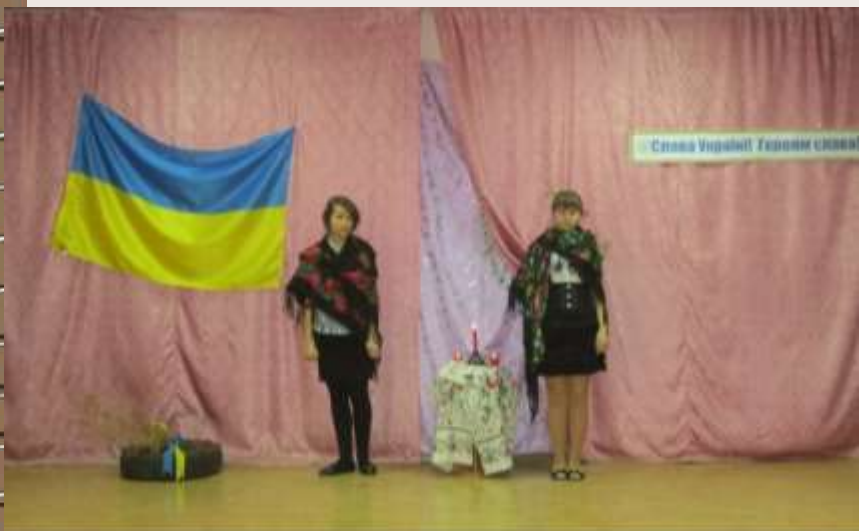
Вшанування Героїв Небесної сотні